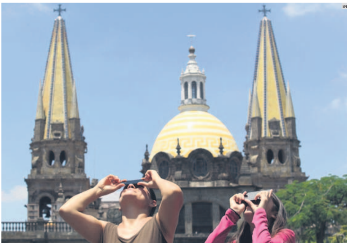
INTERÉS. Los tapatíos disfrutaron del eclipse parcial de Sol que, a través de filtros, pudieron observar desde distintas zonas. Incluso el Instituto de Astronomía y Meteorología de la UdeG abrió sus puertas y prestó un telescopio.