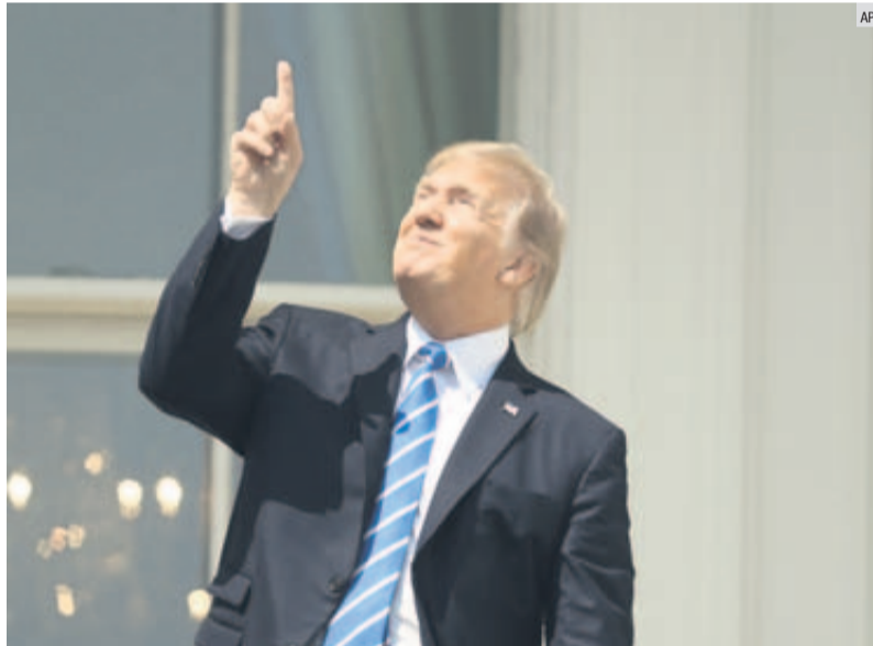
SIN PROTECCIÓN. Donald Trump salió a un balcón de la Casa Blanca para observar el fenómeno, aunque por unos instantes lo hizo sin ninguna protección.

La UdeG reporta que hay aumento de giros de venta de cerveza; sólo Guadalajara señala que combate las anomalías